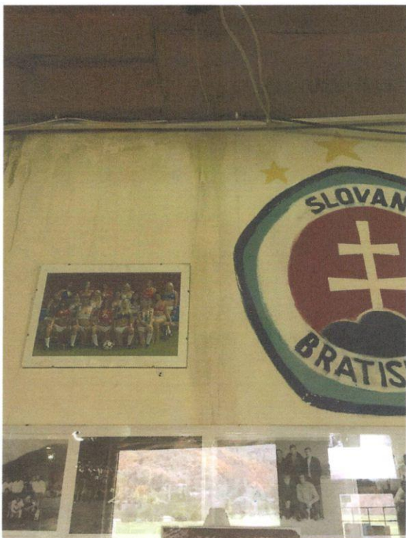
Najväčší zdroj zatekania